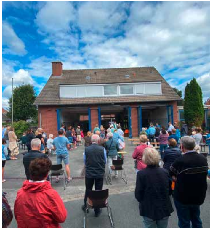
„Gottesdienst an einem anderen Ort“ am alten Feuerwehrhaus.

Allen Ideengeber/-innen und Helfer/-innen sei Dank! Die Pandemie zwang viele Gruppen und Vereine dazu, ihre geplanten Veranstaltungen absagen zu müssen. Immer wieder las man: Termin abgesagt! Nun muss der für den November verhängte „Lockdown light“ zeigen, was er gebracht hat und wie es für den Advent und die Weihnachtsfeiertage weitergehen kann. Bleiben wir zuversichtlich und erwarten wir die Freude der Ankunft und das Licht des Herrn.