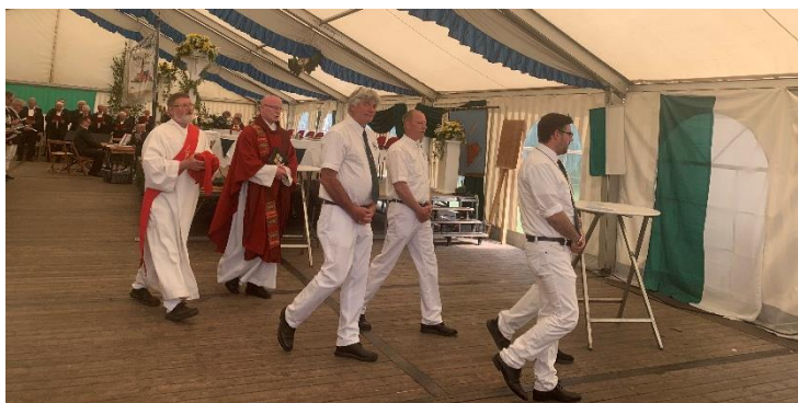
Am Pfingstsonntag fand die Schützenmesse mit dem Männergesangsverein im Festzelt statt.