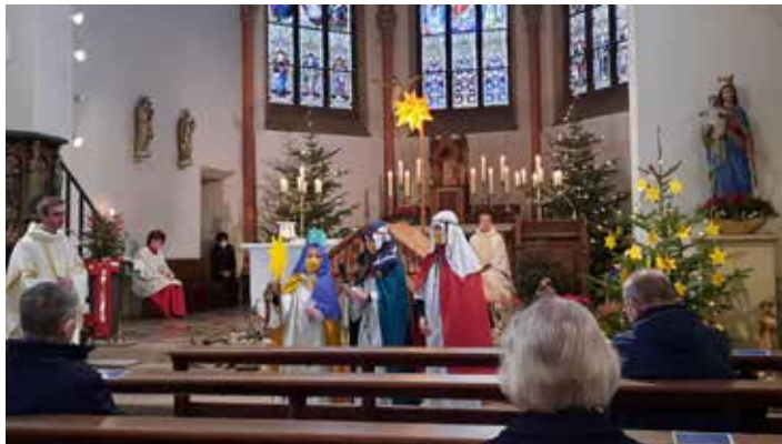
Stellvertretend für alle Sternsinger Albachtens nahm jeweils eine Gruppe am Wochenende an den Gottesdiensten teil.