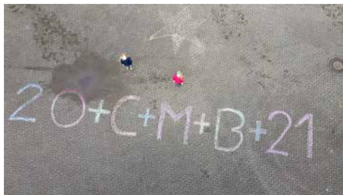
Lara (9) und Theresa (7) schrieben für die Bewohner des Seniorenheims den Segensspruch „20+C+M+B+21“ auf den Marktplatz.

Segenaufkleber und Spendentüten in der Kirche bereitliegen. Jeweils eine Sternsingergruppe übermittelte der Gemeinde in den Gottesdiensten am Wochenende ihre Neujahrswünsche. Stellvertretend für die knapp 60 Kinder und Erwachsene, die sich an der Aktion beteiligt hätten, nahmen sie den Applaus der Gemeinde entgegen.